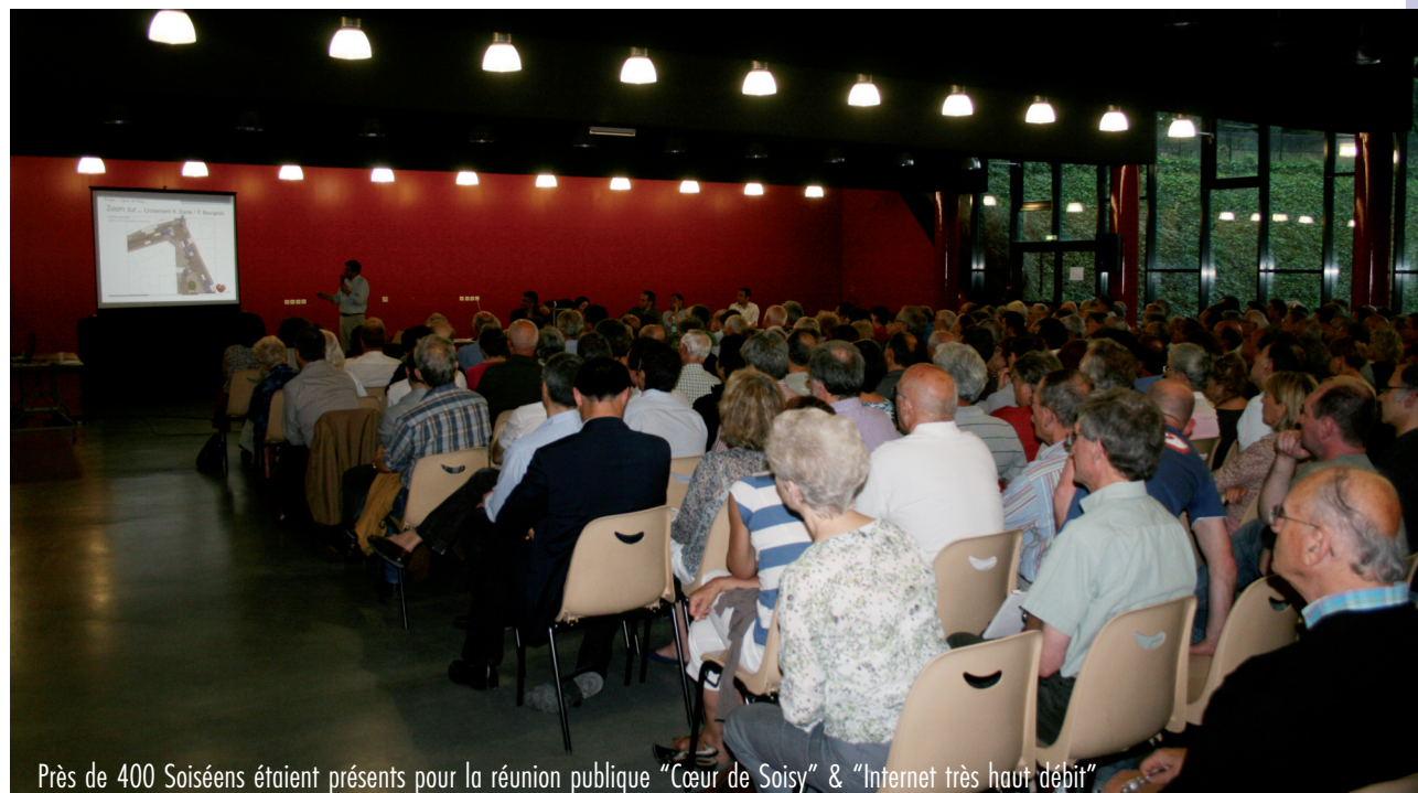
Près de 400 Soiséens étaient présents pour la réunion publique "Cœur de Soisy" & "Internet très haut débit"

L e 24 mai dernier, la Municipalité a proposé aux Soiséens de faire un point d'étape sur deux grands dossiers concernant notre commune : le projet "Cœur de Soisy" et le dossier "Internet très haut débit". Près de 400 personnes ont répondu à l'invitation.