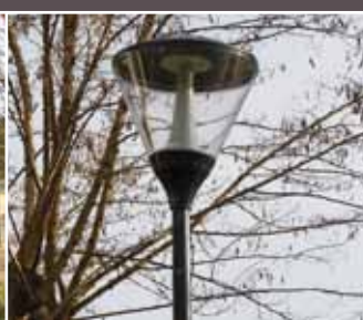
> Autres travaux : Le nouvel éclairage du Chemin rural du Grand Veneur

Afin d'améliorer et de sécuriser la circulation des piétons, à la nuit tombée, 14 nouveaux candélabres ont été installés sur le chemin rural du Grand Veneur (5 sur la première section entre la rue de l'Ermitage et la rue Jean de La Fontaine, 9 sur la seconde section entre la rue Jean de La Fontaine et la rue François Villon). À noter que l'intensité lumineuse de ces candélabres sera réduite dans les prochains jours pour limiter la gêne de certains riverains.