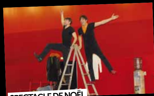
SPECTACLE DE NOËL