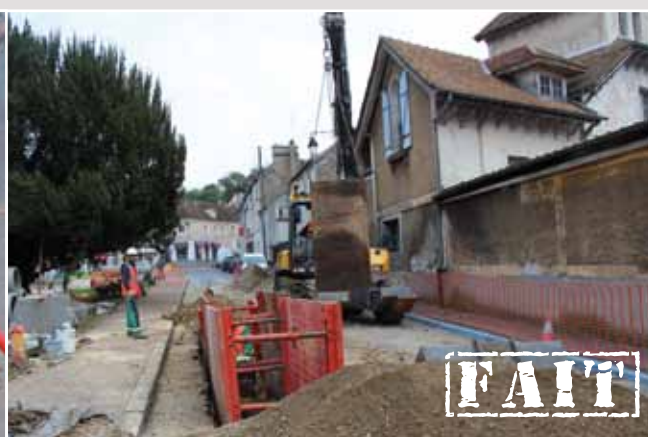
> Rue Notre Dame «Tronçon place de l'église» Travaux sur les réseaux «eaux usées / eaux pluviales» Octobre 2017 (4 semaines de travaux)