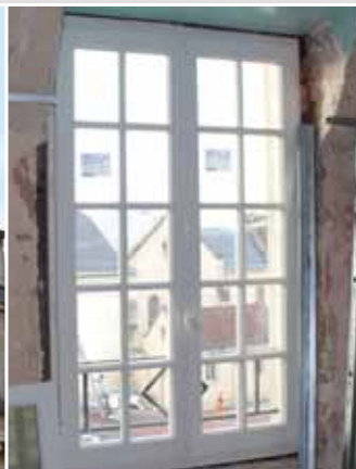
> Rénovation complète du Château des Chenevières - Rénovation des planchers, - Remplacement des menuiseries.