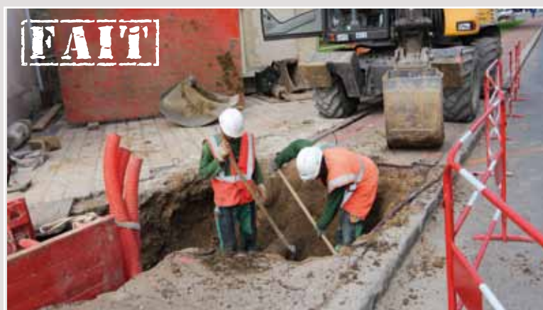
> Rue de l'Église et carrefour «RD448/rue de l'Église/ Avenue Chevalier» Travaux sur les réseaux «eaux usées / eaux pluviales» Septembre 2017 (4 semaines de travaux)

_Les travaux du «Cœur de Soisy», se poursuivent conformément au calendrier prévisionnel.