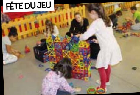
FÊTE DU JEU