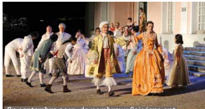
En septembre 2017, de nombreux Soiséens ont participé à la pièce «Les 2 Pompadour»