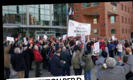
MANIFESTATION RER D

16 février : Les usagers mécontents du RER D ont manifesté nombreux devant la Mairie d'Evry Courcouronnes, dont le Maire est Vice Président aux transports du Conseil Régional.