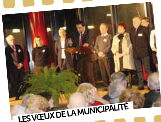
LES VŒUX DE LA MUNICIPALITÉ