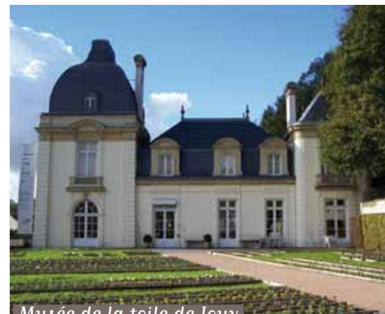
Musée de la toile de Jouy

Inscriptions sur la liste «Loisirs Seniors : vous pouvez vous inscrire si vous êtes soiséen(ne), si vous avez plus de 65 ans, en Mairie au service Solidarité Seniors. Le formulaire d'inscription (PDF à imprimer) est disponible sur le www.soisy-sur-seine.fr (rubrique «Seniors»)