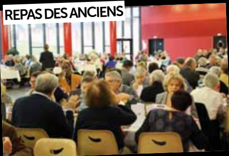
REPAS DES ANCIENS

27 janvier : Plus de 250 seniors de la commune ont partagé le traditionnel «Repas des Anciens» organisé par la Municipalité. Les jeunes danseuses de «Créa'Danse» leur ont proposé deux prestations de qualité.