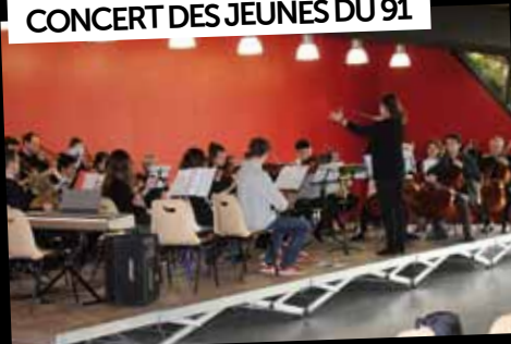
CONCERT DES JEUNES DU 91

3 février : Les talents des conservatoires de l'Essonne étaient réunis, Salle du Grand Veneur, pour un grand concert.