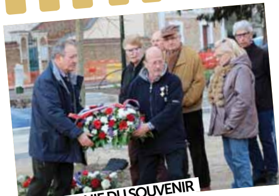
CÉRÉMONIE DU SOUVENIR

19 mars : A l'invitation de la FNACA, une cérémonie d'hommage s'est tenue au Monument aux Morts pour les soldats d'Algérie, du Maroc et de la Tunisie.