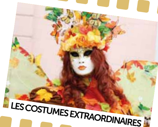
LES COSTUMES EXTRAORDINAIRES

Des costumes magnifiques (masques vénitiens, costumes historiques, Cosplay, Steampunk) ont déambulé dans le parc du Grand Veneur. Un grand merci à l'association «Au fil des idées» pour ce spectacle féerique.