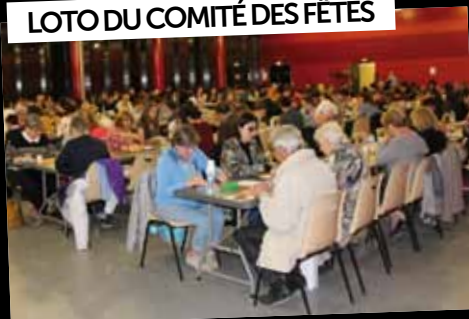
LOTO DU COMITÉ DES FÊTES

30 mars : Le Comité des Fêtes a organisé son loto annuel, à la Salle du Grand Veneur.