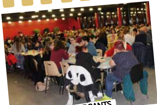
LOTO DES COMMERÇANTS

11 janvier : Les commerçants de Soisy-sur-Seine ont organisé leur loto annuel. De très nombreux Soiséens(nes) se sont présentés pour participer et remplir la Salle du Grand Veneur.