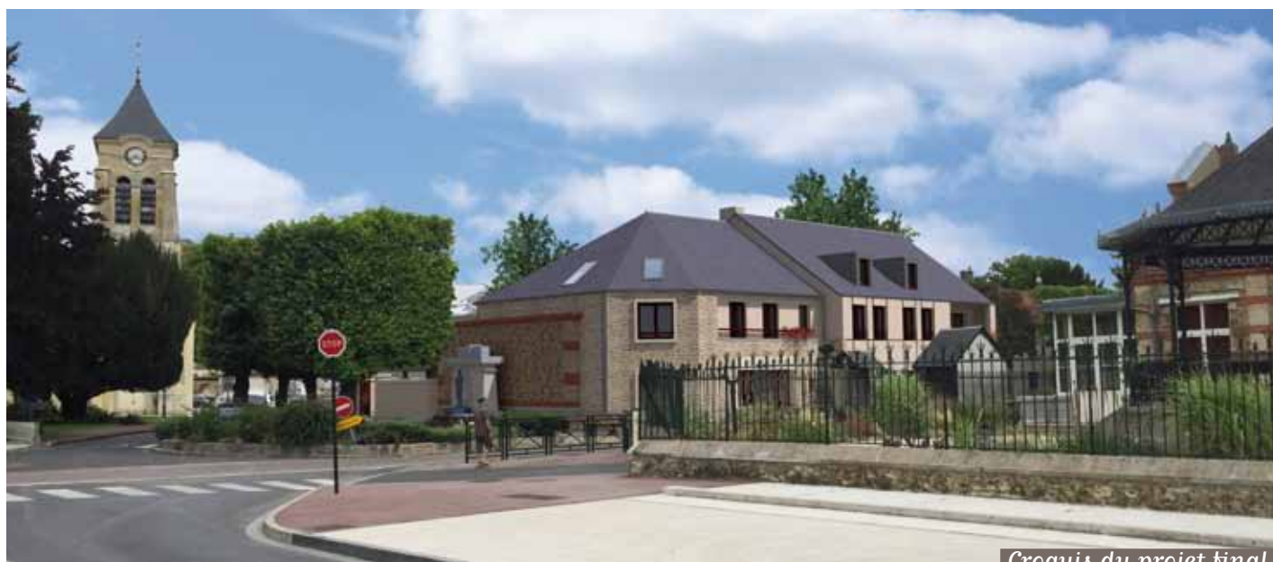
Croquis du projet final

En février dernier, le bâtiment technique situé à l'arrière du Monument aux Morts a été détruit. D'ici quelques semaines, un nouveau bâtiment sortira de terre, comprenant le laboratoire d'analyses médicales, actuellement situé rue Berthelot, et 8 logements aidés (2 et 3 pièces).