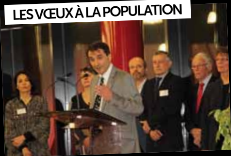
LES VŒUX À LA POPULATION

17 janvier : Le Maire et ses élus ont présenté leurs vœux pour 2020, aux nombreux habitants présents.