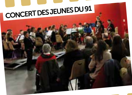
CONCERT DES JEUNES DU 91

2 février : Les jeunes talents musiciens de l'Essonne (élèves des conservatoires du Département) se sont donnés rendez-vous à Soisy pour un concert de grande qualité.