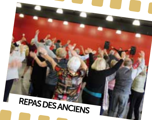
REPAS DES ANCIENS

26 janvier : 260 seniors ont partagé le traditionnel «Repas des Anciens» organisé par la Municipalité. Repas convivial et danse étaient au programme de cet après-midi de fête.