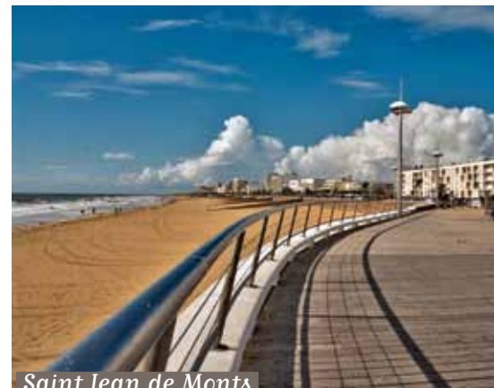
Saint Jean de Monts

Inscriptions sur la liste «Loisirs Seniors : vous pouvez vous inscrire si vous êtes soiséen(ne), si vous avez plus de 65 ans, en Mairie au service Solidarité Seniors. Le formulaire d'inscription (PDF à imprimer) est disponible sur le www.soisyurSeine.fr (rubrique «Seniors»)