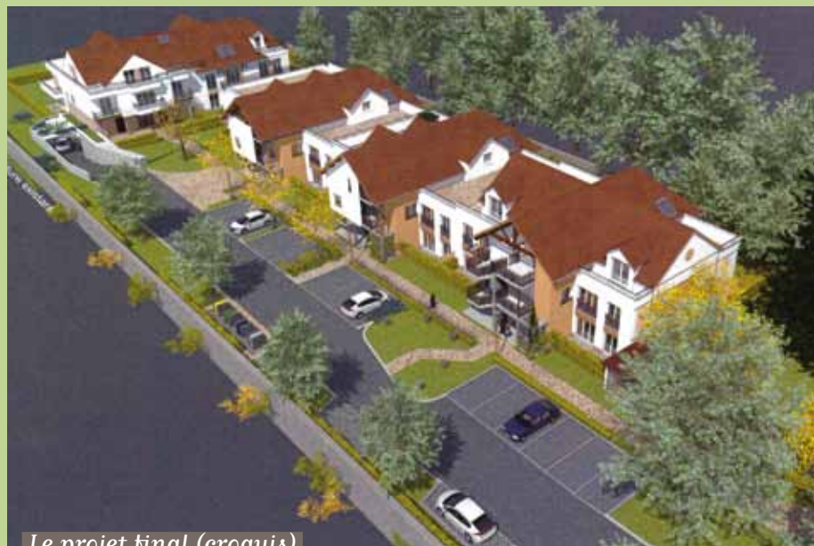
Le projet final (croquis)