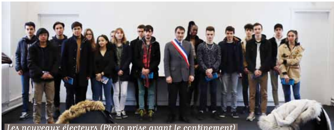
Les nouveaux électeurs (Photo prise avant le confinement)

Comme chaque année, les jeunes majeurs soisiens sont reçus en Mairie afin de recevoir leur première carte d'électeur, synonyme d'inscription sur les listes électorales de la commune. C'est l'occasion pour le Maire de Soisy-sur-Seine, Jean-Baptiste Rousseau, de leur rappeler l'importance du «Droit de vote» et la nécessité d'accomplir cet acte citoyen.