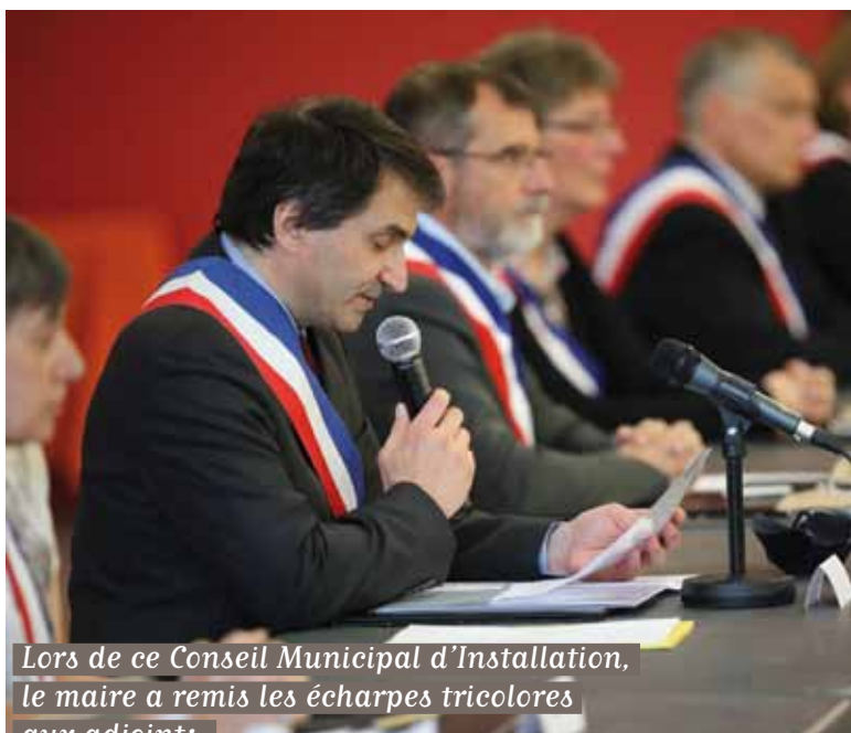
Lors de ce Conseil Municipal d'Installation, le maire a remis les écharpes tricolores aux adjoints.