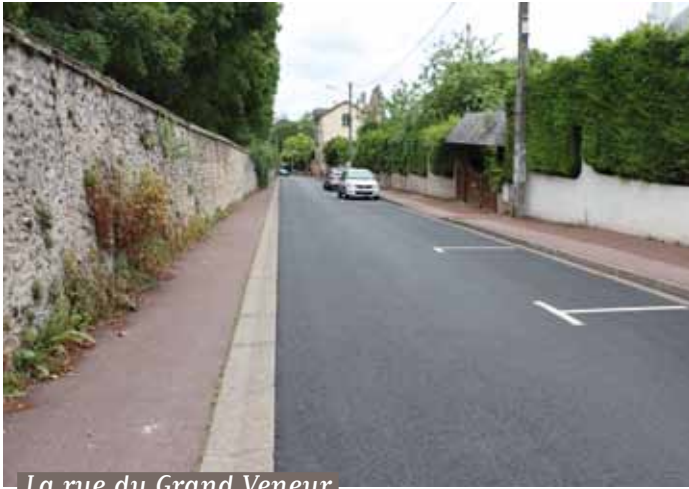
La rue du Grand Veneur