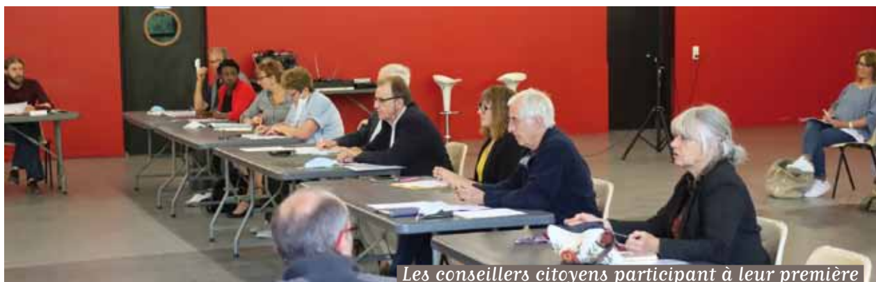
Les conseillers citoyens participant à leur première commission avant le Conseil Municipal du 22 juin.

Le 8 juin dernier, à l'occasion du deuxième Conseil Municipal, un tirage au sort a désigné les 10 membres du «Conseil Citoyen» de Soisy-sur-Seine, parmi 100 candidats.