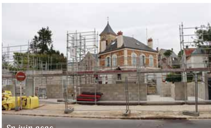
En juin 2020