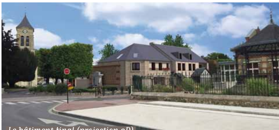
Le bâtiment final (projection 3D)

Le chantier devrait se terminer au cours de l'été 2021.