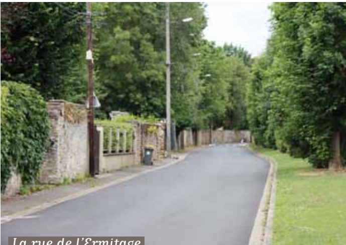
La rue de l'Ermitage