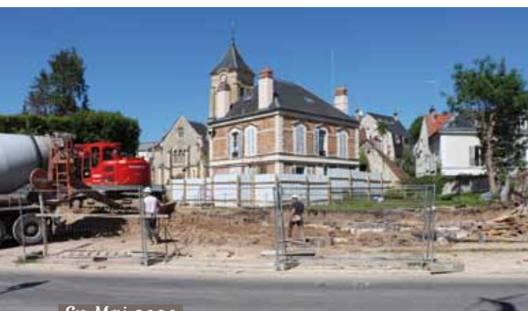
En Mai 2020