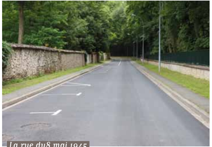
La rue du 8 mai 1945