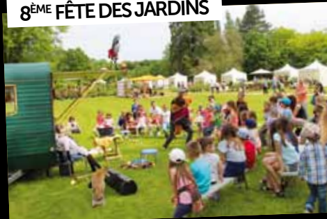
8 ÈME FÊTE DES JARDINS

21/22 mai : Malgré un dimanche pluvieux, la 8 ème édition de la «Fête des Jardins» a réuni les nombreux amoureux du jardin et des plantes.