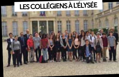
LES COLLÉGIENS À L'ÉLYSÉE

29 juin : Les collégiens de l'Ermitage qui ont réalisé le «Drapeau» en hommage aux victimes des attentats ont été reçus au Palais de l'Élysée.