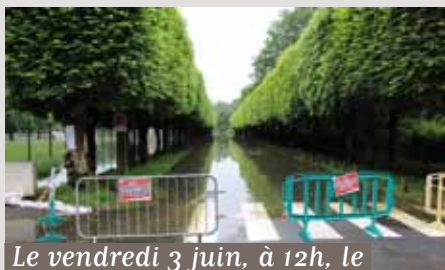
Le vendredi 3 juin, à 12h, le pic de la crue est atteint.

usées, sur l'ensemble de la commune (voir article «Pourquoi...» ci-contre). De plus, certains quartiers ne disposent plus d'approvisionnement électrique (voir article «Pourquoi...» ci-contre).