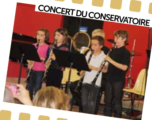
CONCERT DU CONSERVATOIRE

Les élèves et les professeurs du Conservatoire Municipal ont donné leur concert de fin d'année, en présence d'un nombreux public.