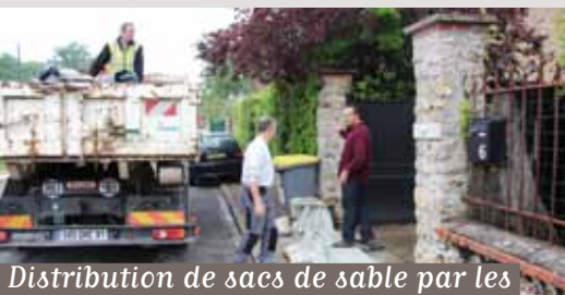
Distribution de sacs de sable par les agents des services techniques

Police Municipale, les gendarmes, les bénévoles et les riverains concernés se relaient sur le terrain, et surveillent la montée progressive des eaux (5 cm/h).