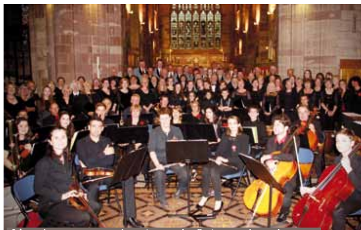
L'orchestre symphonique de Soisy et les chœurs d'Ashbourne dans l'Eglise Saint Oswald

Cet échange a permis de resserrer les liens, déjà privilégiés, entre nos communes.