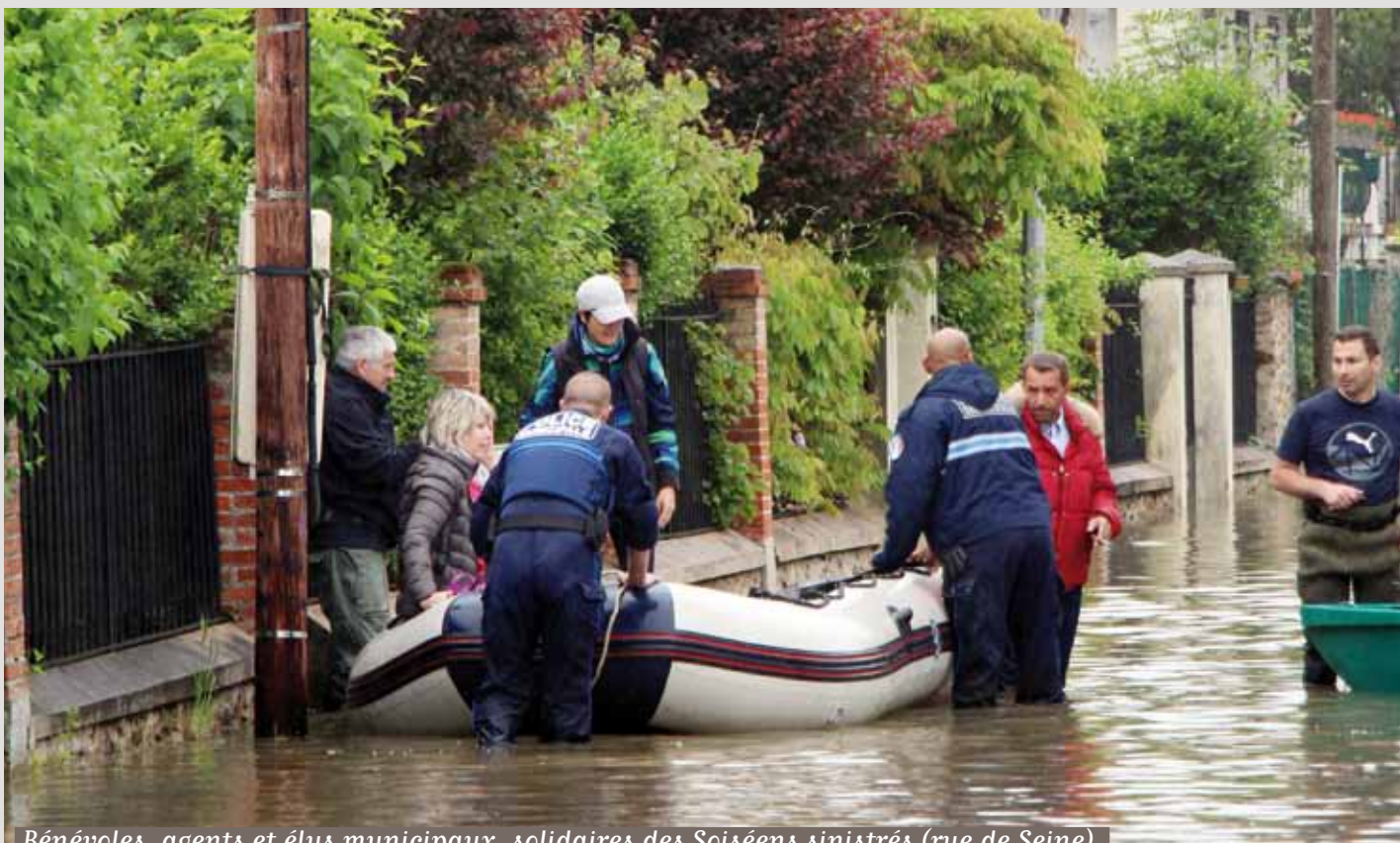
Bénévoles, agents et élus municipaux, solidaires des Soiséens sinistrés (rue de Seine).