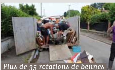
Plus de 35 rotations de bennes ont été assurées.

La Municipalité sollicite la Lyonnaise des Eaux et Enedis afin de remettre en service progressivement, au fur et à mesure de la décrue, les équipements électriques et les réseaux d'assainissement. Avec le recul des eaux, les Soiséens constatent l'ampleur des dégâts. Les pompiers et les bénévoles, sollicités par la Mairie, participent activement au nettoyage. Dès le 6 juin, 7 bennes sont installées dans la ville, et permettent aux