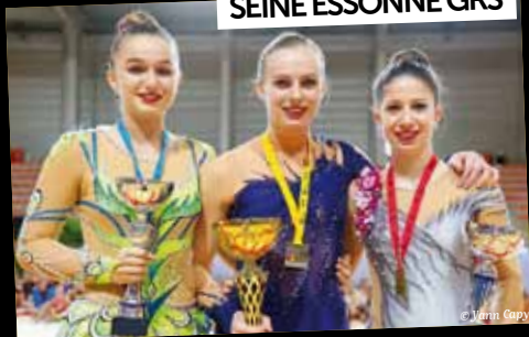
SEINE ESSONNE GRS

21/22 mai : Malgré un dimanche pluvieux, la 8 ème édition de la «Fête des Jardins» a réuni les nombreux amoureux du jardin et des plantes.