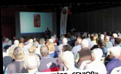
SÉCURITÉ ROUTIÈRE «SENIOR»

17 octobre: Les seniors soiséens et Etiollais ont participé avec les gendarmes à une journée de sensibilisation à la sécurité routière.