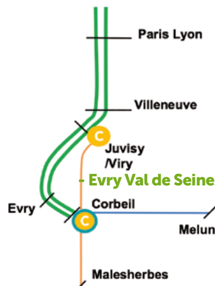
image de la présentation SNCF du 4/01/2017

Cette nouvelle contrainte du changement s'ajoute à un contexte difficile en matière de transport avec :