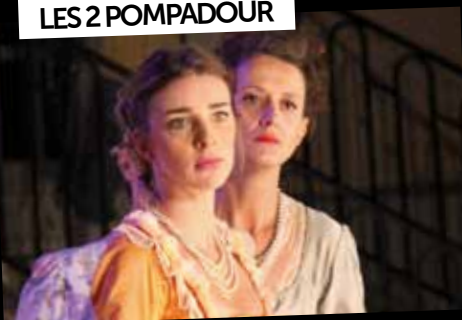
LES 2 POMPADOUR

15, 16 & 17 septembre: Ce week-end «histoire locale» était consacré à Mme de Pompadour et aux philosophes des Lumières. Plus de 400 Soiséens(nes), garderont le merveilleux souvenir de ce spectacle en plein air !