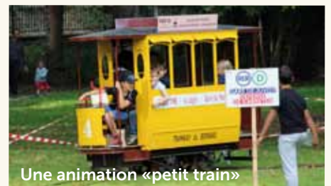
Une animation «petit train»