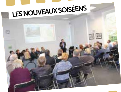
LES NOUVEAUX SOISÉENS

7 octobre: Les nouveaux arrivants à Soisy ont été accueillis par le Maire et son équipe, à l'occasion d'une cérémonie conviviale en Mairie.