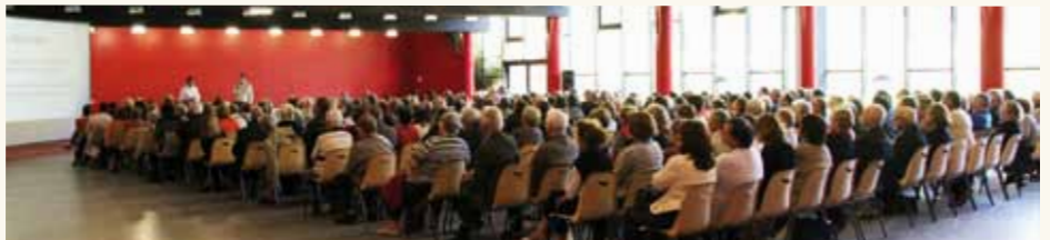
Une réunion publique en présence de plus de 300 personnes, et des élus locaux