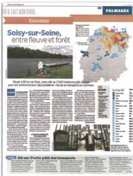
Article «Le Parisien» du 23 septembre 2017

Le 23 septembre dernier, le journal «Le Parisien» a publié un palmarès des communes les plus agréables en Île-de-France. Soisy obtient la meilleure note du Département, et se classe 21 ème au niveau régional.