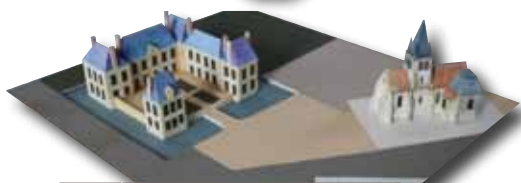
XVII ème siècle > avant 1730

Au Moyen-Âge , une «Maison forte féodale» est installée en lieu et place du futur château seigneurial de Soisy. La chapelle du château est à l'origine de la future église paroissiale. La maquette est inspirée d'un «château de plaine» (type «Farcheville», en Essonne). On note la présence de douves autour de la maison fortifiée et très certainement d'un pont-levis.