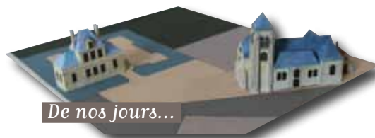
De nos jours...