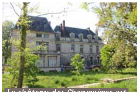
Le château des Chenevières est en cours de rénovation. Ces travaux devraient se terminer avec la création d'un parvis en fin d'année 2018

Plus d'un an et demi de travaux à venir !