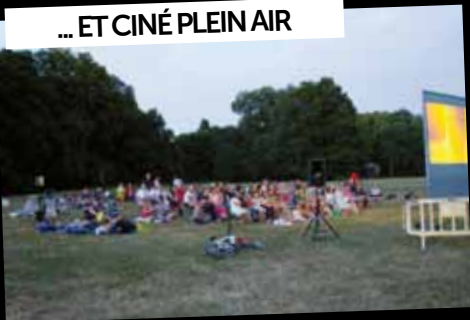
... ET CINÉ PLEIN AIR

8 juillet: Le soir, après un pique-nique, de nombreuses familles ont assisté à la projection, en plein air, du film «Astérix et Obélix: Mission Cléopâtre».