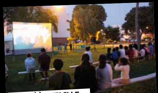
CINÉ À GERVILLE

26 août: Le ciné plein air de la commune s'est installé au cœur de la résidence de Gerville, pour la projection du film «Insaissables».