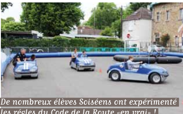
De nombreux élèves Soiséens ont expérimenté les règles du Code de la Route «en vrai» !

En mai dernier, certaines classes des écoles élémentaires des Donjons et des Meillottes ont participé à ces deux journées de prévention routière, organisées par Grand Paris Sud, la Municipalité et l'Automobile Club.