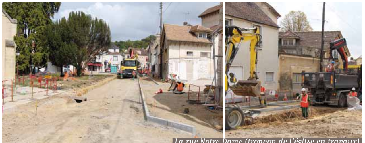
La rue Notre Dame (tronçon de l'église) en travaux

Depuis le 3 septembre 2018, la rue Notre Dame (tronçon de l'Église) est fermée à la circulation et au stationnement. Durant toute la période des travaux (2 mois), un plan de circulation alternatif a été mis en place pour les véhicules légers et les bus et poids lourds.