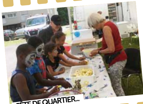
FÊTE DE QUARTIER...