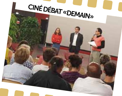
CINÉ DÉBAT «DEMAIN»

25 août : Pour marquer la fin des vacances, la Ville a proposé le film «Rio», au cœur de la résidence de Gerville. Un bon moment pour petits et grands.