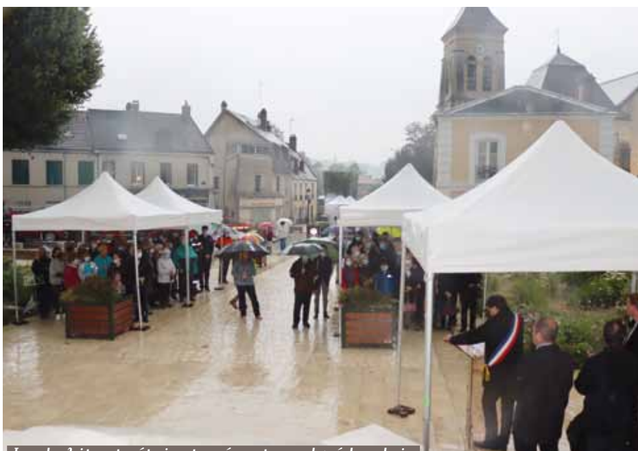
Les habitants étaient présents malgré la pluie