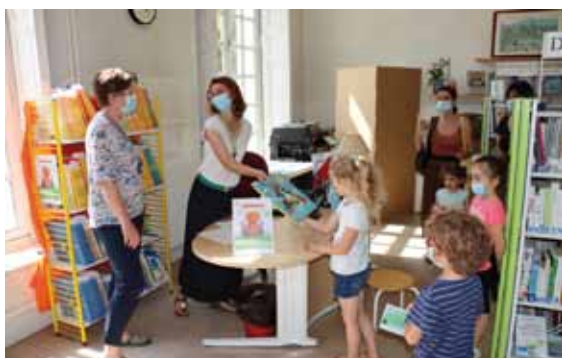
Les livres ont été remis individuellement à la médiathèque municipale

i > Pour plus d'informations, contactez le secrétariat de M. le Maire au 01 69 89 71 62