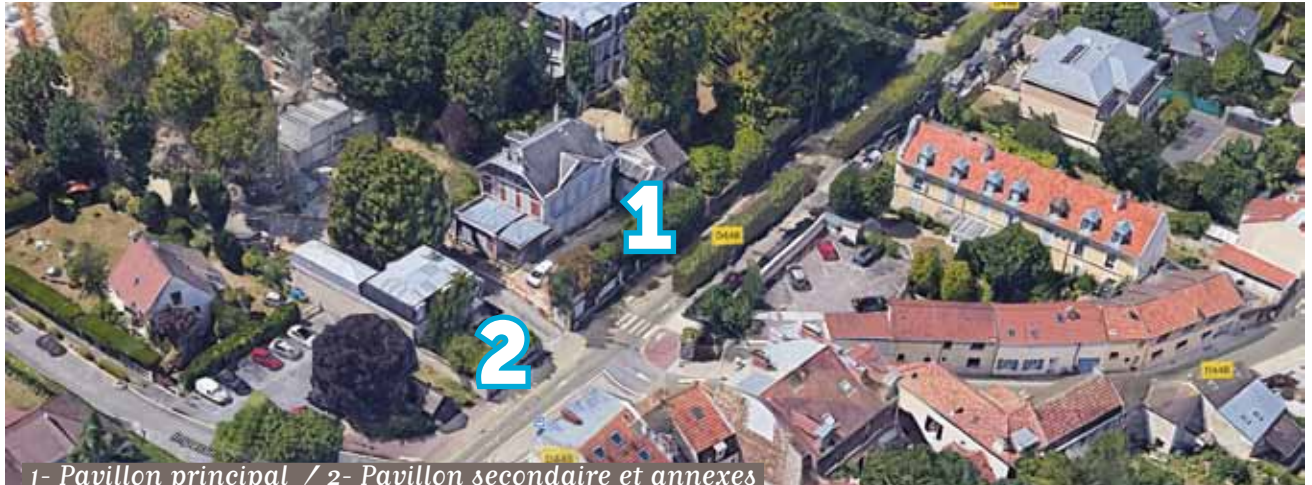
1- Pavillon principal / 2- Pavillon secondaire et annexes

Les dossiers de candidature sont disponibles et à rendre avant le 30 septembre 2021.