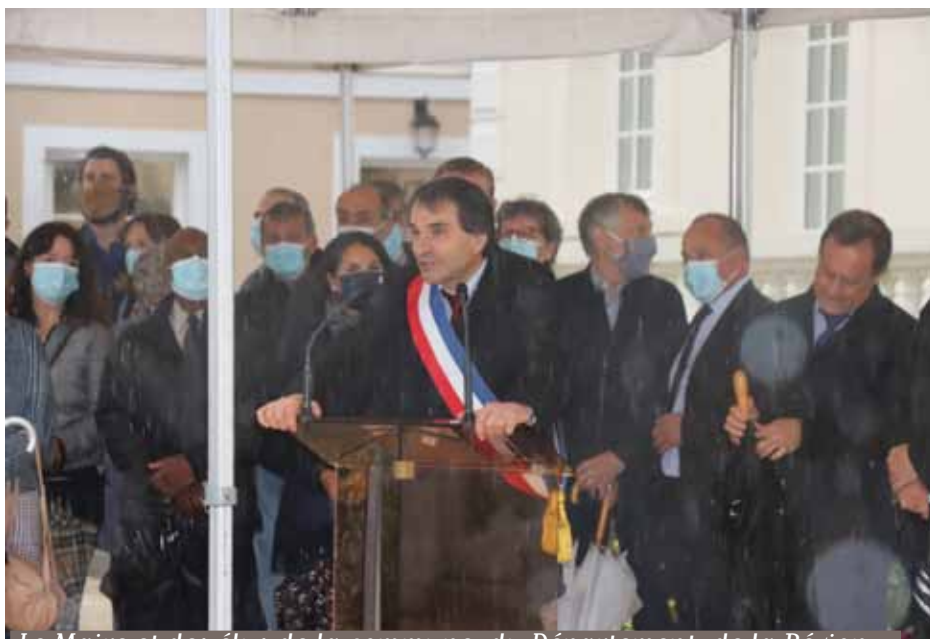
Le Maire et des élus de la commune, du Département, de la Région...