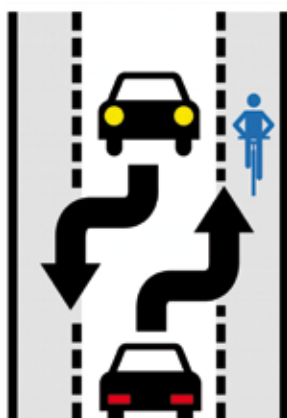
Principe du Chaucidou

L a commune poursuit ses actions en faveur des zones de circulation partagée et apaisée. Après un centre-ville placé en «Zone 30», certaines voiries placées en «Zone de rencontre» (limitation à 20km/h et priorité piétons et vélos), un chaucidou installé rue du Bac de Ris, des «contresens vélo» aménagés rues des Meillottes et des Carrières, et le parc des Chenevières ouvert aux circulations douces, la commune et la communauté d'agglomération Grand Paris Sud réaliseront, dans les prochaines semaines, 2 nouveaux aménagements, notamment pour protéger les écoliers et les collégiens sur leurs trajets quotidiens :