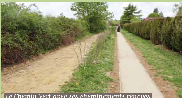
Le Chemin Vert avec ses cheminements rénovés