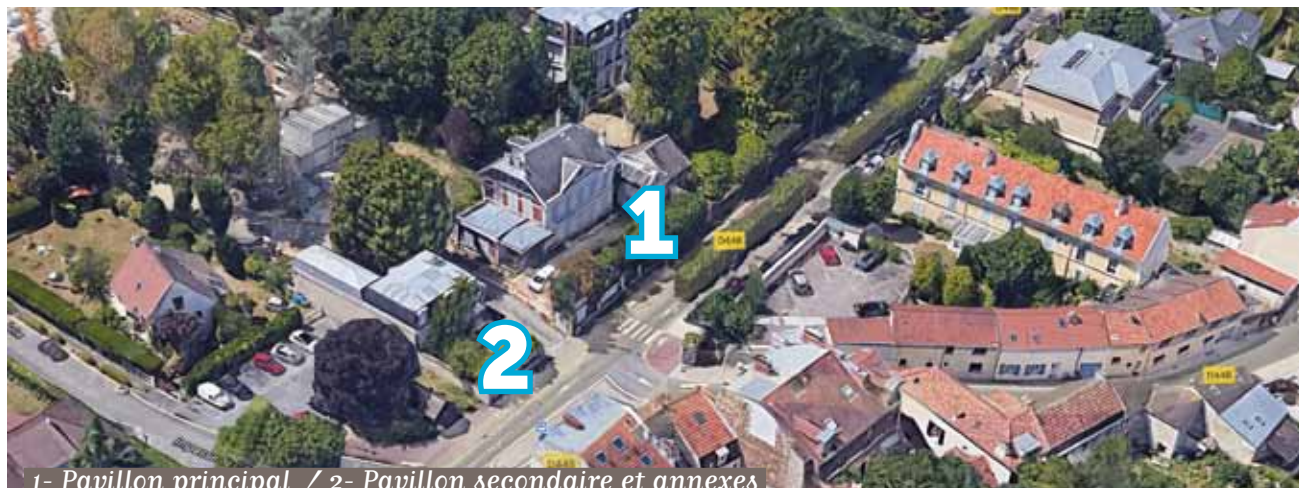
1- Pavillon principal / 2- Pavillon secondaire et annexes

Les dossiers de candidature sont à déposer en Mairie avant le 30 juin 2021.