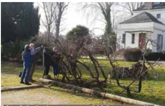
Les bénévoles ont procédé à une «taille légère» des pommiers, en mars dernier

> adhésion à l'association en remplissant le formulaire en ligne