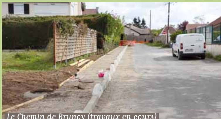
Le Chemin de Brunoy (travaux en cours)