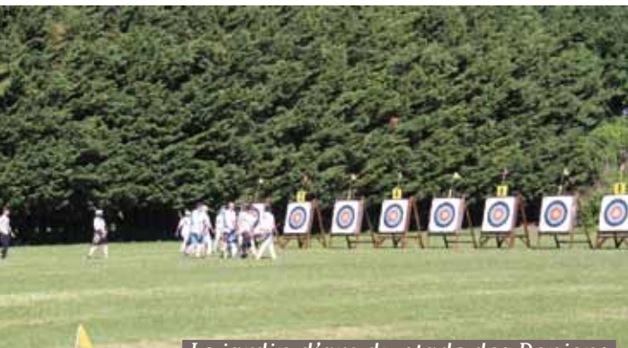
Le jardin d'arc du stade des Donjons

D epuis septembre 1968, les «Archers du Grand Veneur» pratiquent le tir à l'arc à Soisy-sur-Seine. Dans un premier temps, au sein du club «La Cible de Soisy», puis en association autonome à partir de novembre 1979. Ils prennent alors le nom d'Archers du Grand Veneur. À cette époque, le premier «jardin d'arc» était alors installé dans le Parc du Château du Grand Veneur. C'est en 1986 qu'il a été déplacé au stade des Donjons, rue du Bac de Ris.