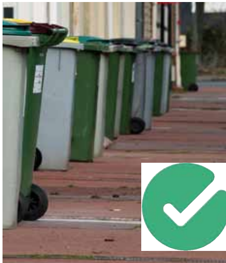
Alignement correct contre le mur