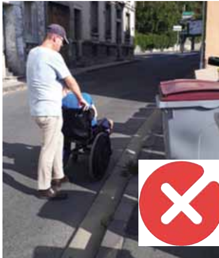
Alignements incorrects et gênants