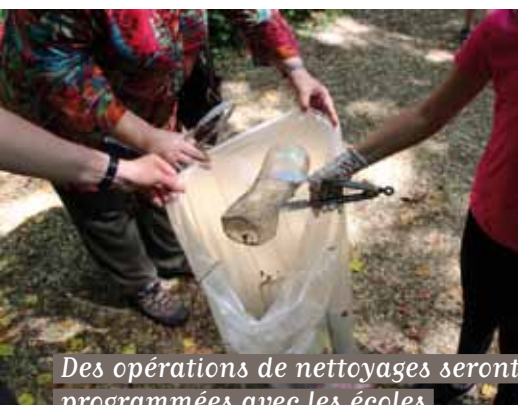
Des opérations de nettoyages seront programmées avec les écoles

_En 2022, les élus de Soisy souhaitent renouer avec les actions collectives citoyennes et proposent plusieurs journées dédiées à «la réduction des déchets».