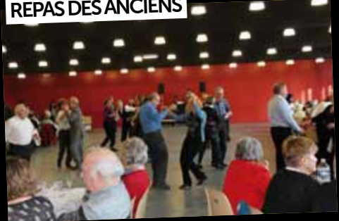
REPAS DES ANCIENS

22 janvier: Plus de 250 seniors ont partagé le «repas des anciens». Ce moment de convivialité et de gastronomie était accompagné de musique et de danse !