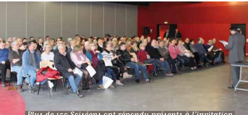
Plus de 150 Soisiens ont répondu présents à l'invitation de Jean-Baptiste Rousseau, Maire de Soisy-sur-Seine

Le 28 janvier dernier, le Maire de Soisy-sur-Seine a invité les usagers soisiens du RER D à une rencontre pour les informer du projet de modifications sur le RER D, proposé par la SNCF.