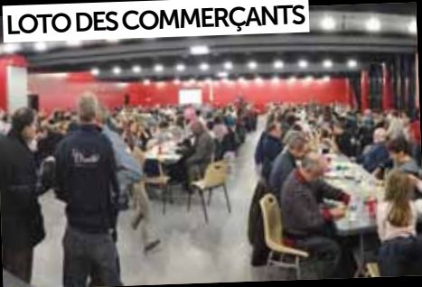
LOTO DES COMMERÇANTS

22 janvier: 300 Soiséens, de toutes générations, se sont retrouvés à l'invitation des commerçants de Soisy, pour un loto convivial.