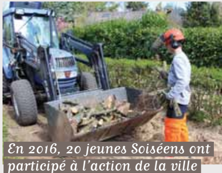
En 2016, 20 jeunes Soiséens ont participé à l'action de la ville

Toutes ces formes de participation portent l'intérêt collectif et participent au «bien vivre ensemble», à Soisy !