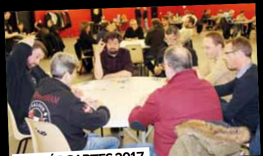
SOIRÉE CARTES 2017

25 février: Près de 100 joueurs ont participé à la 9 ème édition de la «Soirée Cartes».