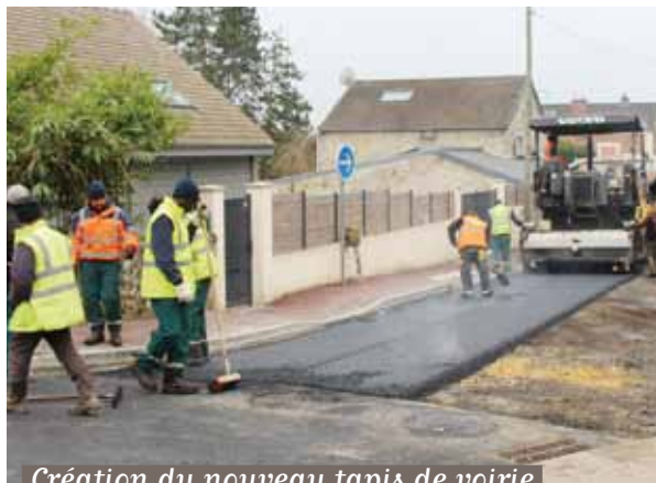
Création du nouveau tapis de voirie

Après quelques semaines de travaux, la rue des Carrières a été réouverte à la circulation en février.