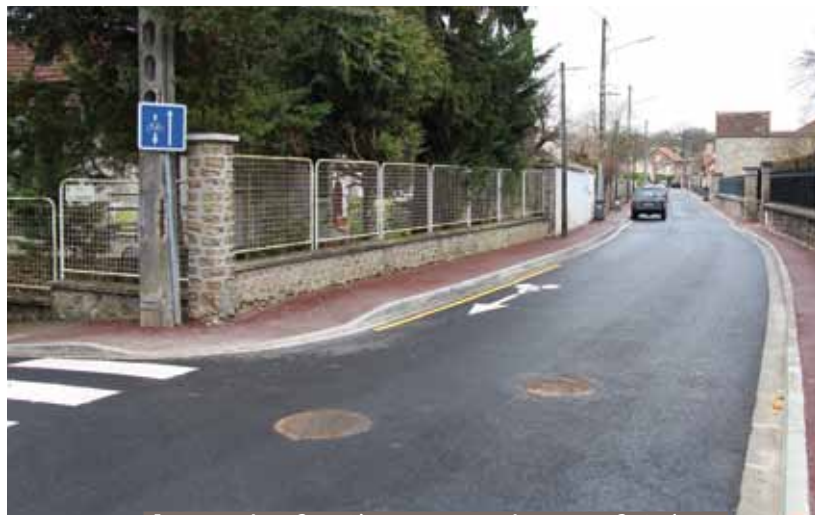
La rue des Carrières est rendue aux Soisédiens

Pour rappel, la rue des Carrières a bénéficié de lourds travaux d'assainissement (remplacement et renforcement des canalisations «eaux usées» et de branchements de particuliers) et d'une rénovation de la voirie (élargissement des trottoirs, réfection de toutes les bordures «côté impair» et reprise complète du tapis). Depuis le 14 février dernier, la circulation y a été réouverte (lignes de bus comprises) avec une reprise du plan de circulation initial.