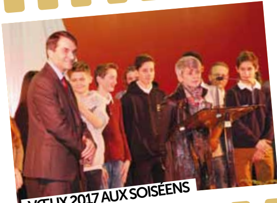
VŒUX 2017 AUX SOISÉENS

13 janvier: Les élus de la commune ont invité l'ensemble des Soiséens à la cérémonie des «Vœux à la population». L'occasion de tracer les perspectives pour l'année à venir, et d'honorer les collégiens de Soisy pour leur «drapeau hommage» aux victimes des attentats.