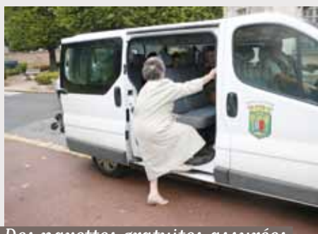
Des navettes gratuites assurées par des bénévoles

L e terme de «citoyenneté» est souvent réduit au simple exercice du «droit de vote». Pourtant, il s'agit de bien plus. La «citoyenneté» se définit aussi en référence à d'autres valeurs :