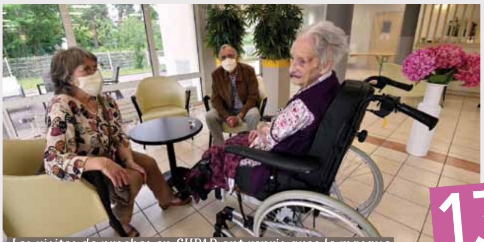
Les visites de proches en EHPAD ont repris avec le masque

Merci à tous ceux qui se sont mobilisés, et se mobilisent encore chaque jour pour nos seniors !