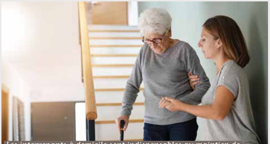
Les intervenants à domicile sont indispensables au maintien de certains seniors dans leur logement

Des sociétés privées locales et/ou des associations agréées proposent des services d'aide à la personne, au domicile des seniors (aides ménagères, auxiliaires