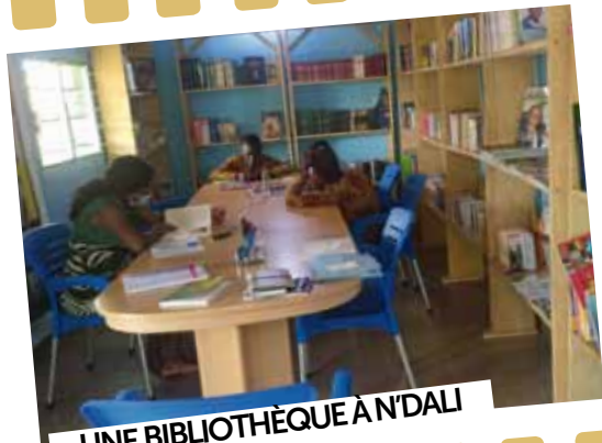
UNE BIBLIOTHÈQUE À N'DALI