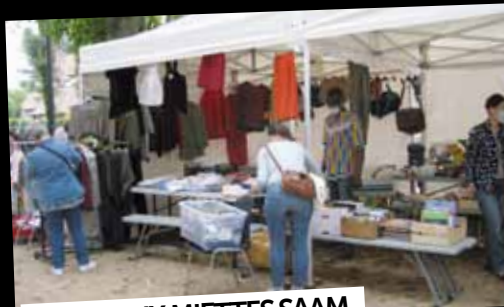
FOIRE AUX MIETTES SAAM

26 septembre : L'association Soisy Aide Au Monde (SAAM) a organisé sa traditionnelle brocante sur les allées Chevalier.