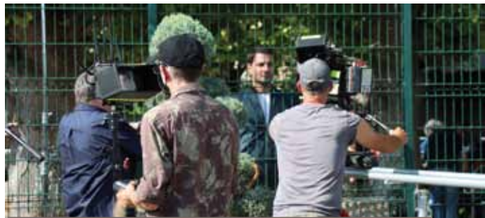
Les enfants du centre de loisirs ont été invités à découvrir les coulisses du tournage

Durant le tournage, les enfants du centre de loisirs ont pu assister au tournage de certaines scènes, et découvrir l'envers du décor : les caméras, les lumières, les prises de son. Une véritable initiation au cinéma en compagnie des professionnels de la production «Incognita TV».